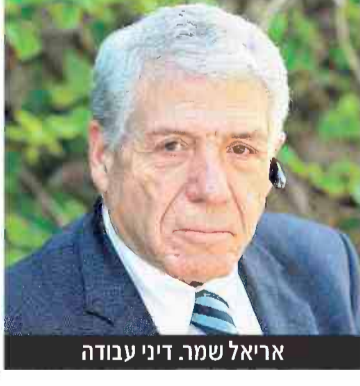
אריאל שמור. דיני עבודה